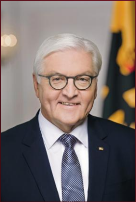
Bundespräsident Frank-Walter Steinmeier