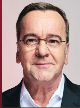
Bundesverteidigungs- minister Boris Pistorius