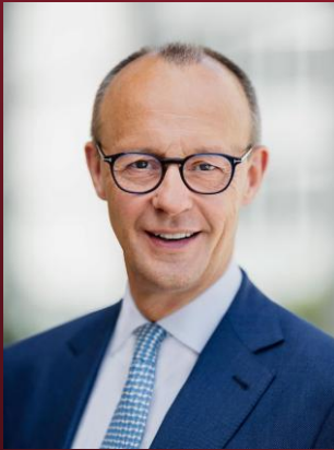
Bundestkanzler Friedrich Merz