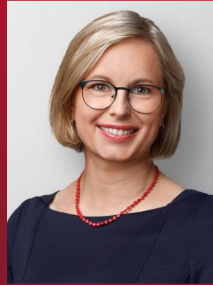
Staatsministerin für Sport und Ehrenamt Dr. Christiane Schenderlein