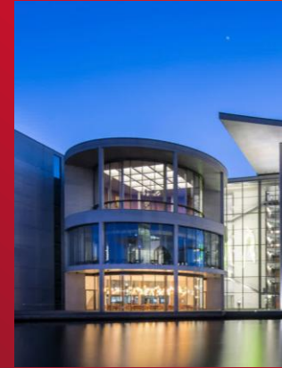
Mitglieder des Ausschusses für Sport und Ehrenamt